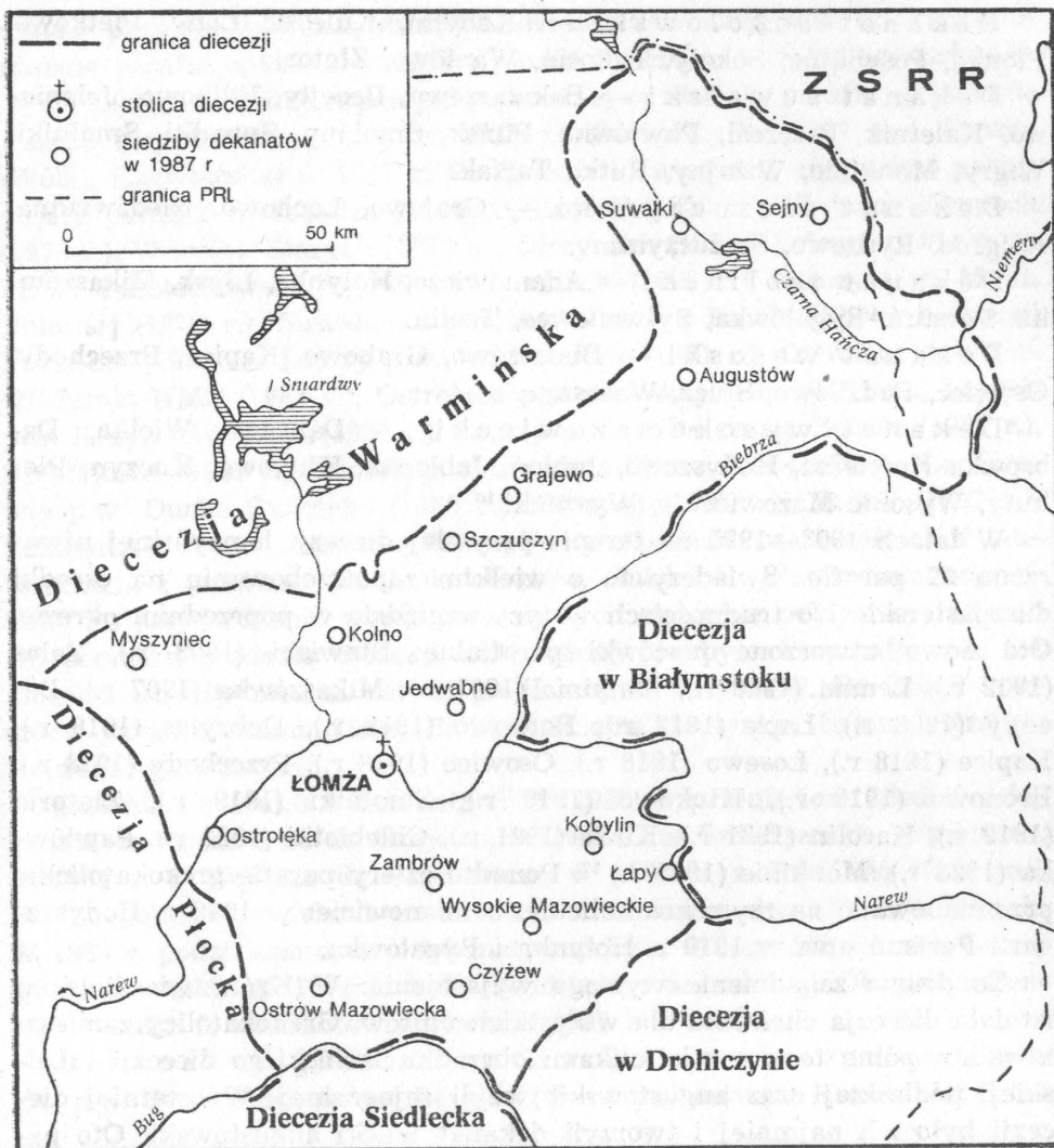
Mapa 3. Diecezja łomżyńska

Kleczków, Łyse, Myszyniec, Nowa Wieś, Ostrołęka, Piski, Rzekuń, Troczyn, Zalas.