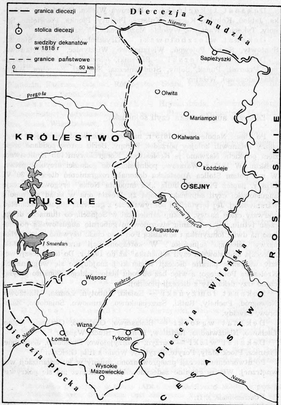
Mapa 2. Diecezja augustowska czyli sejneńska