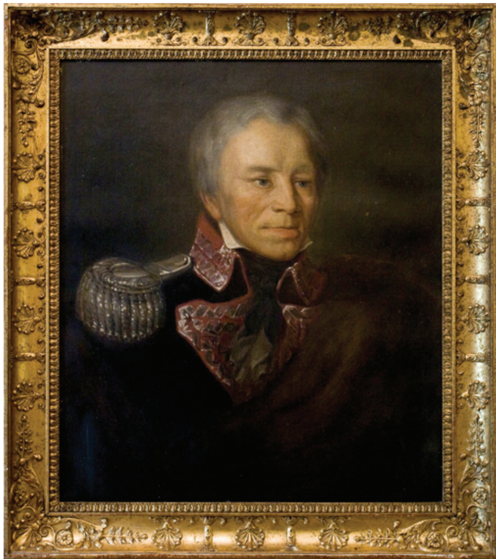
il. 1. Portret gen. Stanisława Mokronowskiego, olej na płótnie, k. XIX w. (zbiory Muzeum Podlaskiego Białymstoku, MB/S/148)