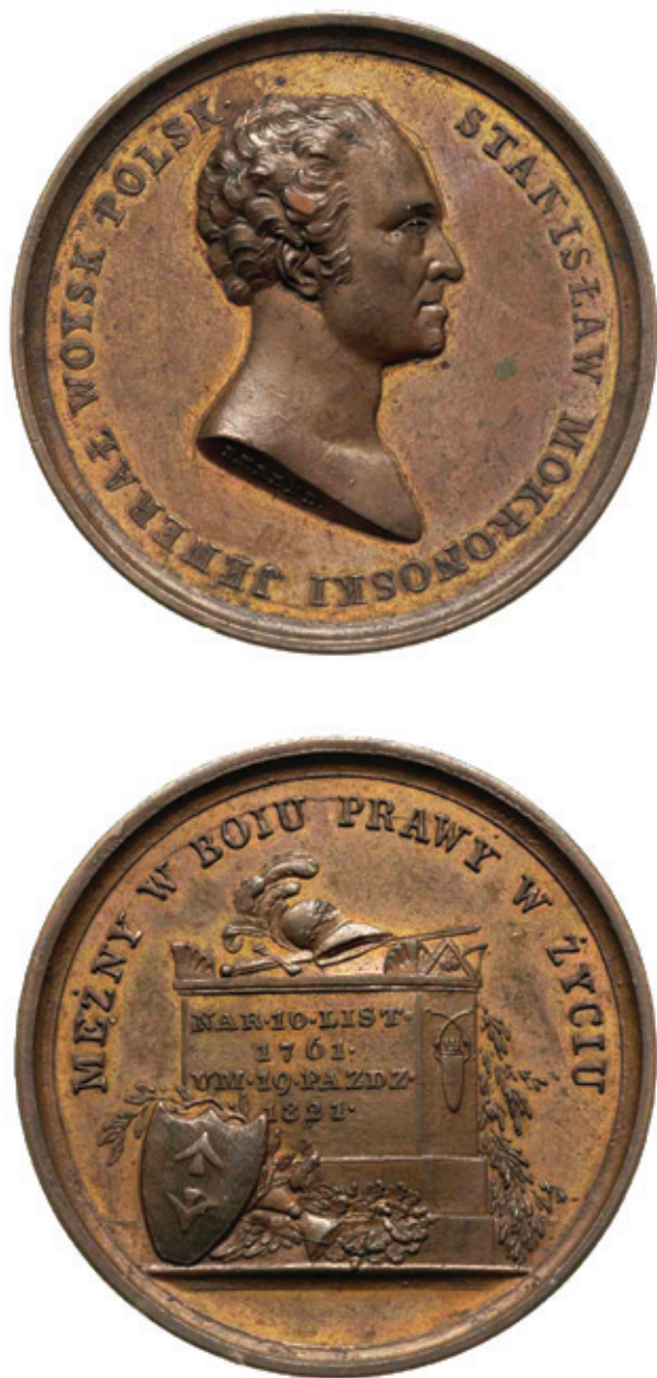
il. 5. Medal pamiątkowy autorstwa Karola Emanuela Baerenda dla uczczenia śmierci generała (ok. 1821 r.)