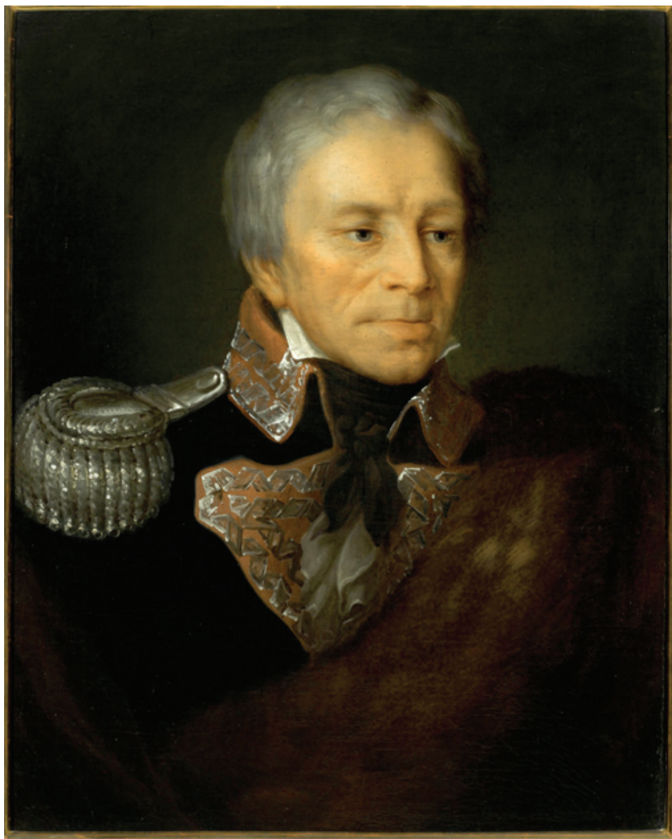
il. 2. Portret gen. Stanisława Mokronowskiego, olej na płótnie, ok. 1820 r. (zbiory Muzeum Pałacu Króla Jana III w Wilanowie, Wil. 1408)