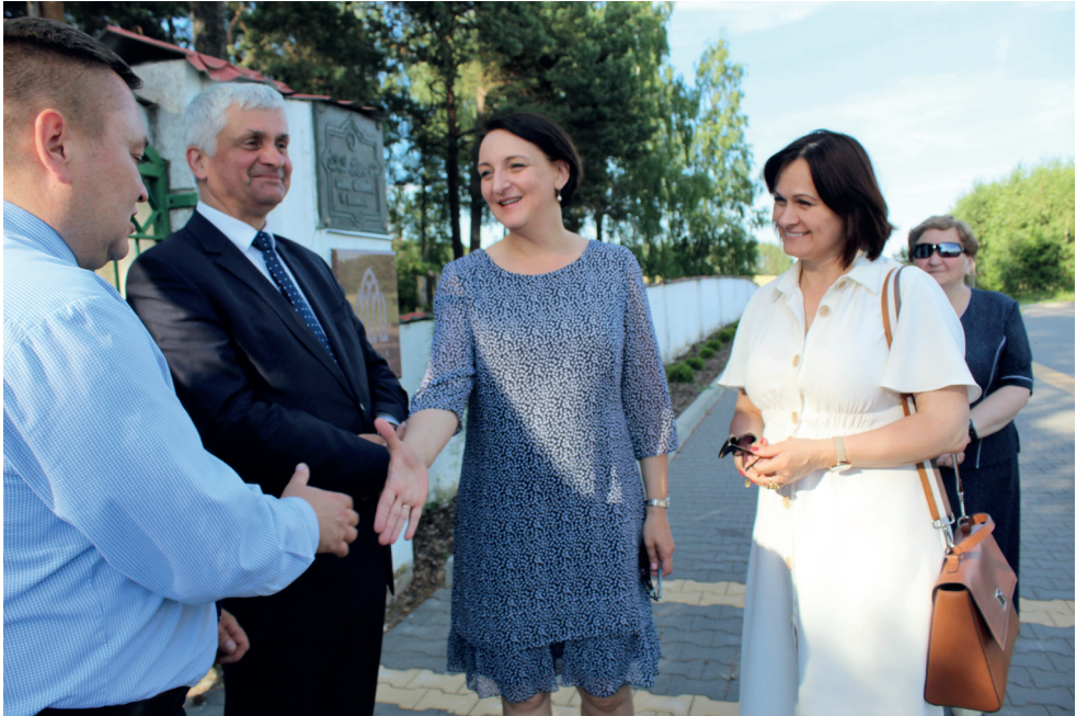
3. Dzień ogłoszenia decyzji o utworzeniu pierwszego w województwie podlaskim Parku Kulturowego w Bohonikach Day of the announcement of the Cultural Park in Bohoniki, the first in the voivodeship of Podlasie