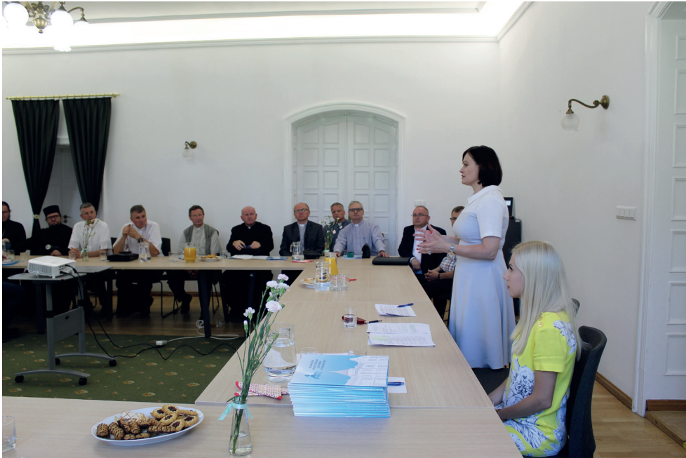
5. Uroczyste wręczenie umów dotacyjnych PWKZ właścicielom zabytków Ceremony of the presentation of the Podlaskie Voivodeship Conservator of Monuments grant agreements to owners of historical monuments

kim Urzędzie Ochrony Zabytków w Białymstoku i jego delegaturach w Łomży i w Suwałkach.