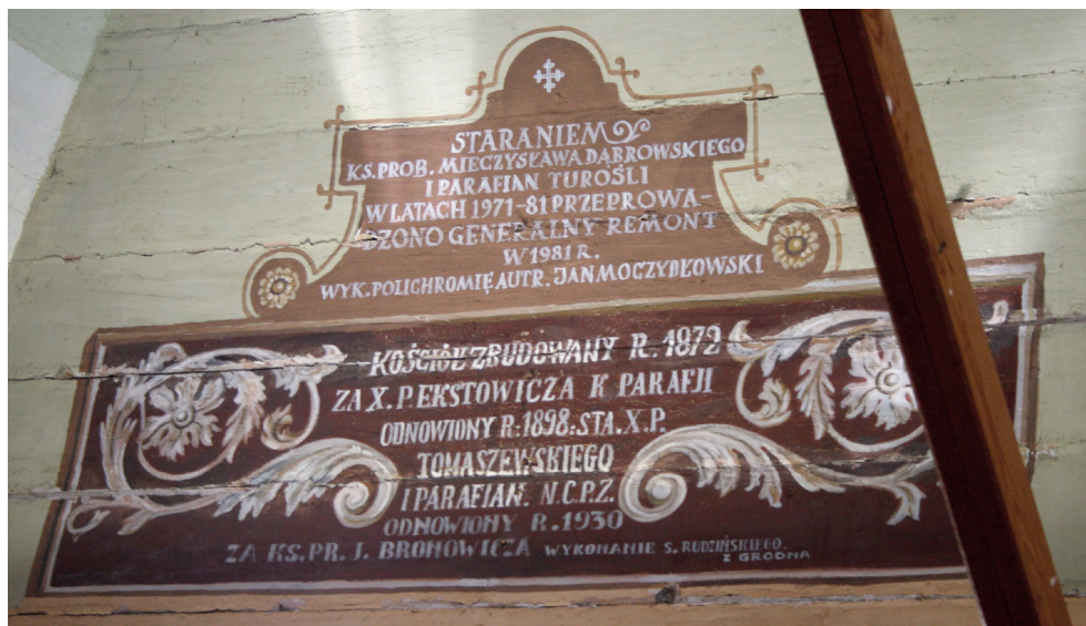
7. Turośl. Kościół pw. św. Jana Chrzciciela. Inskrypcja za ołtarzem głównym, 2014. Turośl. Church of St. John the Baptist. Inscription behind the main altar, 2014.

motywy okuciowe obrysowane ciemnym, brązowym paskiem na jasnym, kremowo-żółtym tle. Powyżej znajduje się szeroki ornament paskowy w kolorach beżu, brązu i bieli.