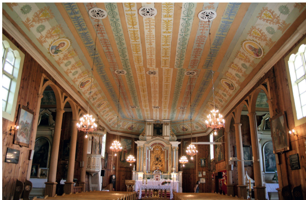
2. Turośl. Kościół pw. św. Jana Chrzciciela. Wnętrze, 2014. Turośl. Church of St. John the Baptist. Interior, 2014.

Obecnie w kościele są trzy ołtarze. W głównym znajduje się obraz Matki Bożej Częstochowskiej zasłaniany obrazem Pana Jezusa na krzyżu, w zwieńczeniu jest obraz Mojżesza. Po bokach ołtarza stały małe figury św. Antoniego i św. Teresy (niestety zostały skradzione). W kaplicy po lewej stronie umieszczono obraz św. Antoniego i nad nim obraz św. Judy Tadeusza. W drugiej kaplicy są obrazy św. Jana Chrzciciela i u góry św. Józefa. Ponadto w kaplicy pod wieżą znajduje się obraz św. Maksymiliana Kolbego 2 .