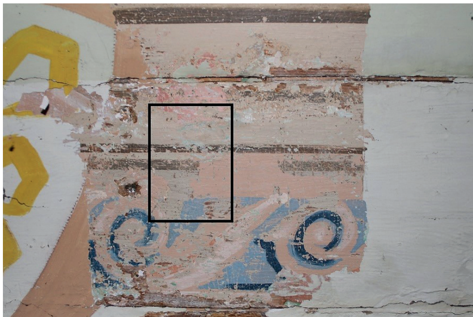
6. Turośl. Kościół pw. św. Jana Chrzciciela. Prace konserwatorskie przy polichromii stropu, centralnie widoczna najstarsza polichromia z lat siedemdziesiątych XIX w., 2016. Turośl. Church of St. John the Baptist. Conservation of ceiling polychrome, in the centre: the oldest polychrome from the 1870s, 2016.

kościół. Wtedy to powstały podmalowania przedstawień po formie, podmalowania tła beżowo-brązowych paskowań oraz zamalowanie nowymi motywami ornamentalnymi części fryzu faset.