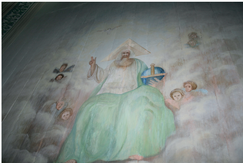
13. Turośl. Kościół pw. św. Jana Chrzciciela. Prace konserwatorskie przy polichromii stropu. Bóg Ojciec po konserwacji, 2018.

W części środkowej stropu, przy chórze, odsłonięty podczas badań fragment postaci okazał się przedstawieniem Boga Ojca ukazanego jako starzec trzymający w prawej dłoni jabłko królewskie, symbolizujące kulę ziemską zwieńczoną złotym krzyżem. Bóg przedstawiony jest w pozycji siedzącej, w zielonym płaszczu, spod którego widać białą szatę ze złotymi wykończeniami. Lewą rękę ma uniesioną w geście błogosławieństwa. Tło kompozycji dekorującej strop utrzymane jest w tonacji szaroniebieskiej. Tło przechodzi w części zbliżonej do postaci Boga w chmury, z których wylaniają się główki aniołków i gołębicę symbolizującą Ducha Świętego.