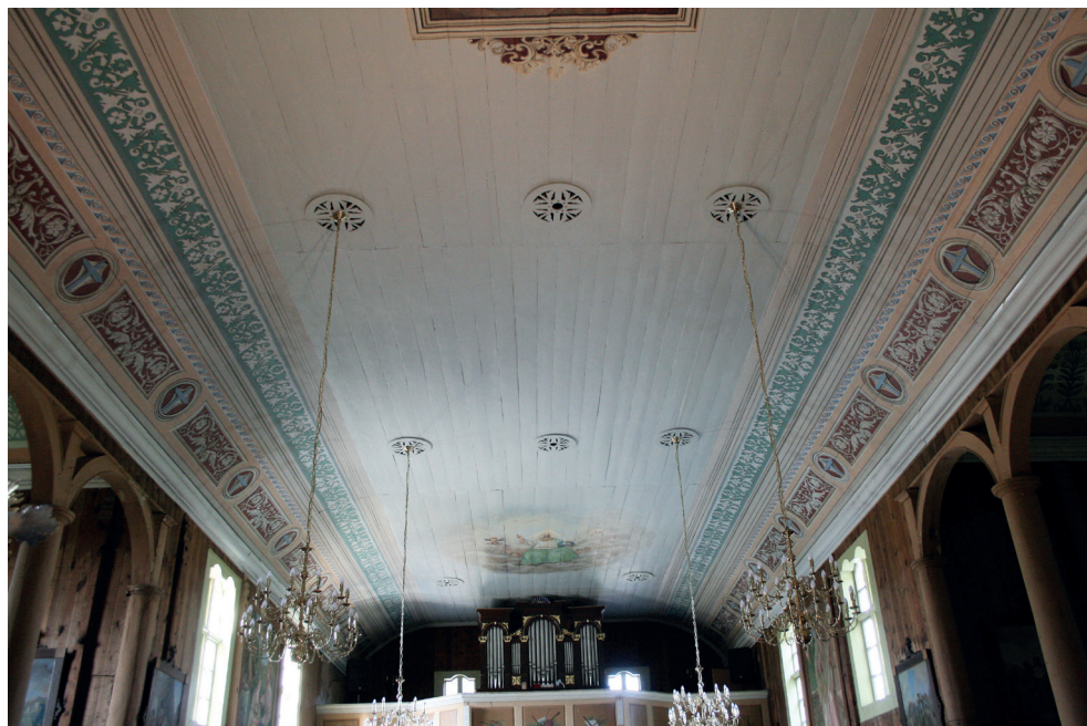
14. Turośl. Kościół pw. św. Jana Chrzciciela. Polichromia po konserwacji, 2018. Turośl. Church of St. John the Baptist. Polychrome after conservation, 2018.

ką Nowinę, trzymający w dłoni złote berło, stojący w długiej szacie przed klęczącą Marią, odzianą w czerwoną suknię i błękitny płaszcz. Na podstawie klęcznika leży biała lilia. Nad całością obrazu unosi się gołębica – Duch Święty. Fasety dekorowane są układem ornamentów – głównym motywem są ujęte w ramy architektoniczne, mięsiste akanty na czerwonym tle i krzyże na tle błękitnym. Powyżej znajduje się pas ornamentu falistego w tonacji błękitów i różów, a nad nim okuciowy ornament w tonacji zieleni. Całości tej partii dopełnia układ pasów w tonacji bieli i brązów. Gzyms koronujący pozostał w kolorze bieli lekko złamanej umbrą. Pozostawiono jako świadka nienaruszony fragment stropu za ołtarzem głównym, gdzie znajdują się również inskrypcje mówiące o historii kościoła oraz kolejnych wykonawcach prac malarskich i konserwatorskich.