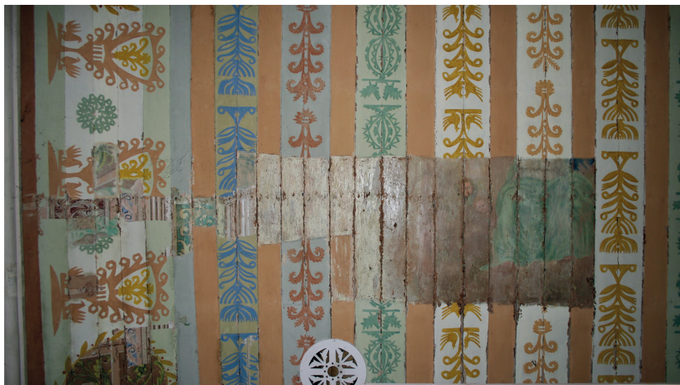
4. Turośl. Kościół pw. św. Jana Chrzciciela. Odkrywka na stropie nawy, 2015. Turośl. Church of St. John the Baptist. Findings on the nave ceiling, 2015.