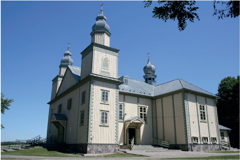
1. Turośl. Kościół pw. św. Jana Chrzciciela, 2016. Turośl. Church of St. John the Baptist, 2016.

pochodzi z 1930 r (trzecia warstwa chronologiczna). W okresie powojennym powstały dwie kolejne warstwy chronologiczne, ostatnia w 1981 r.