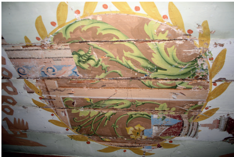
9. Turośl. Kościół pw. św. Jana Chrzciciela. Polichromia stropu, czwarta warstwa chronologiczna znajdująca się pod warstwą z 1971 r., 2015. Turośl. Church of St. John the Baptist. Ceiling polychrome, fourth chronological layer beneath a layer from 1971, 2015.