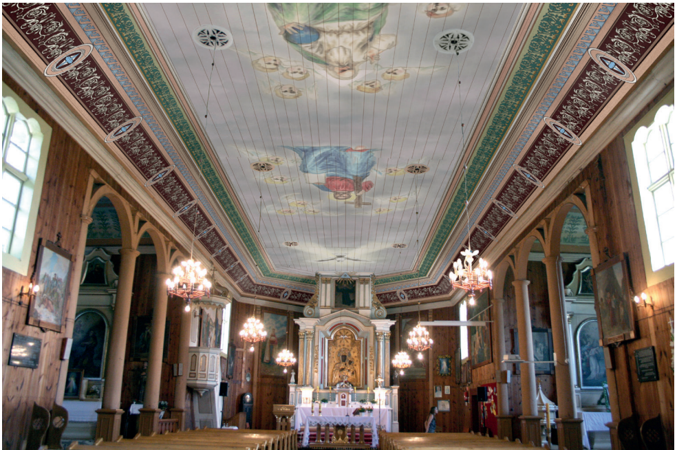
10. Wizualizacja polichromii stropu, 2014. Autor: K. Michałowski Visualisation of ceiling polychrome, 2014. K. Michałowski

Projekt zakładał, że wtórne warstwy przemalowań zostaną usunięte do warstwy pierwotnej w partii centralnej stropu, gdzie występuje przedstawienie, zaś w partiach faset wstępne założenie zakładało usunięcie przemalowań do warstwy z 1898 r., o wartościowych walorach artystycznych, i po wykonaniu pełnego odsłonięcia tej warstwy chronologicznej i uzyskaniu dokładniejszego rozpoznania najstarszej warstwy podjęcie ostatecznych decyzji co do zakresu i stopnia odsłaniania dwóch najstarszych warstw polichromii.