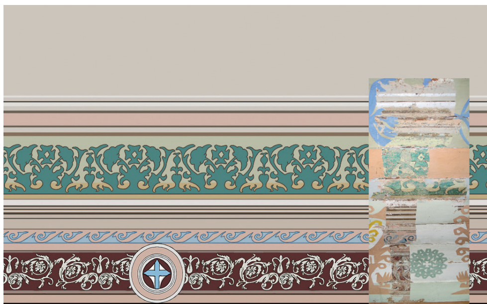
8. Wizualizacja fryzu, 2015. Autor: K. Michałowski Visualisation of the frieze, 2015, K. Michałowski