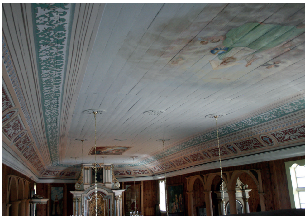
15, 16. Turośl. Kościół pw. św. Jana Chrzciciela. Polichromia po konserwacji, 2018. Turośl. Church of St. John the Baptist. Polychrome after conservation, 2018.