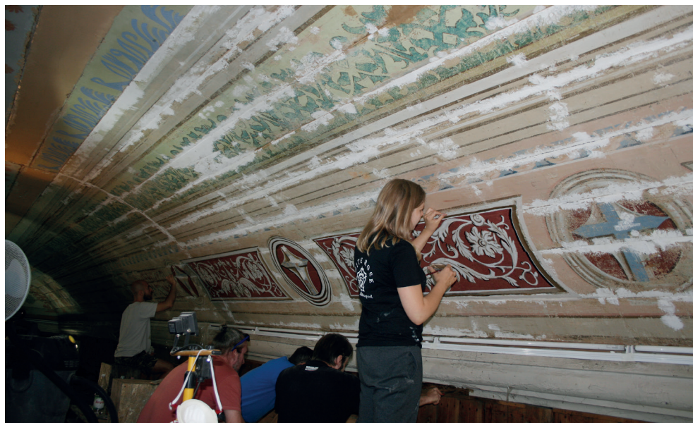
11. Turośl. Kościół pw. św. Jana Chrzciciela. Prace konserwatorskie przy polichromii stropu, 2018.