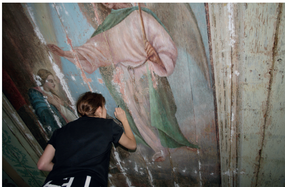
12. Turośl. Kościół pw. św. Jana Chrzciciela. Prace konserwatorskie przy polichromii stropu.

Turośl. Church of St. John the Baptist. Conservation of ceiling polychrome, 2018.