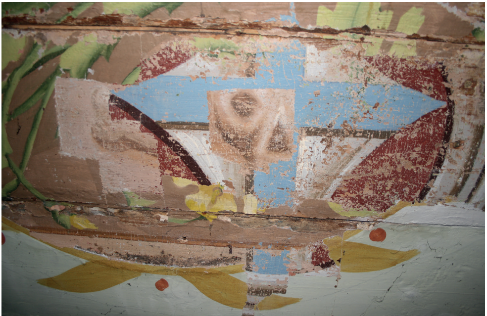
5. Turośl. Kościół pw. św. Jana Chrzciciela. Prace konserwatorskie przy polichromii stropu, centralnie widoczna najstarsza polichromia z lat siedemdziesiątych XIX w., 2016. Turośl. Church of St. John the Baptist. Conservation of ceiling polychrome, in the centre: the oldest polychrome from the 1870s, 2016.

Prawdopodobnie ich skromny przekaz, a być może słaba technicznie jakość wykonania były powodem „odnowienia” w 1898 r., czyli po 26 latach od powstania