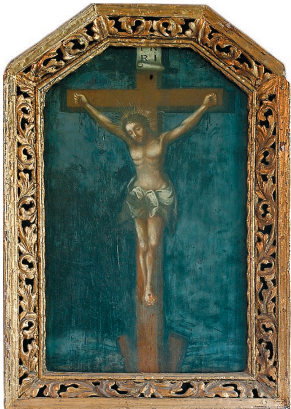
1. Obraz Ukrzyżowanie w ramie, stan przed konserwacją. The Crucifixion framed, state prior to conservation.