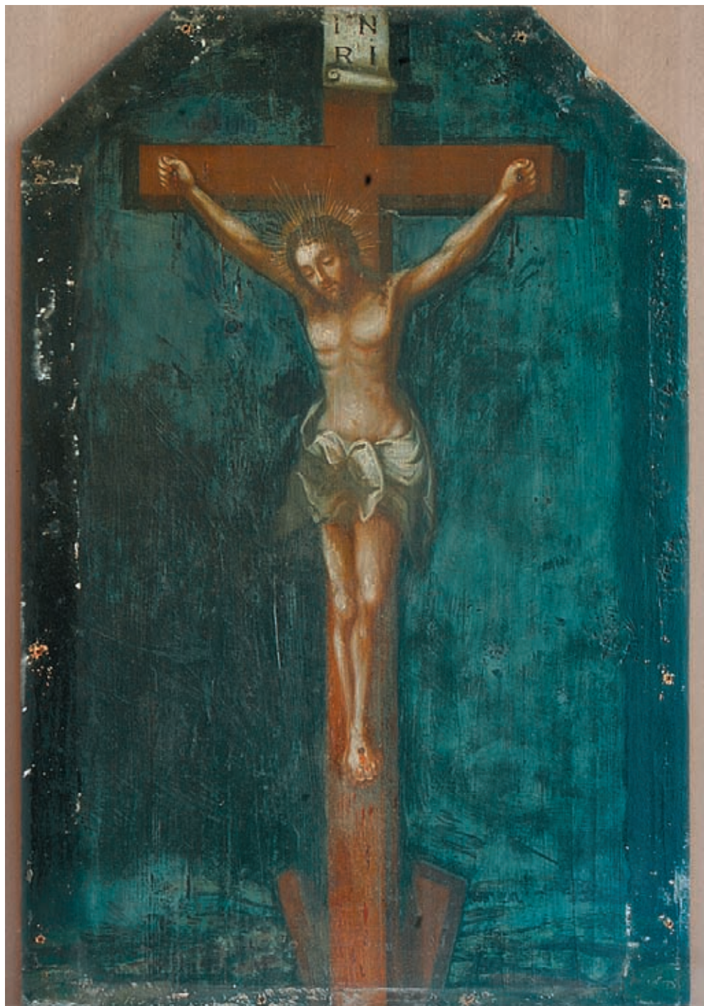
2. Obraz Ukrzyżowanie przed konserwacją, po zdemontowaniu ramy. The Crucifixion prior to and after conservation but with removed frame.