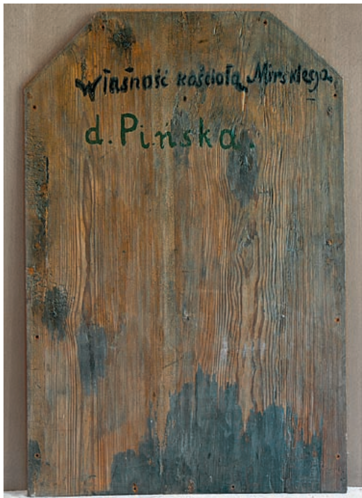
3. Odwrocie obrazu Ukrzyżowanie przed konserwacją. Reverse of The Crucifixion prior to conservation.

Obraz po wyjęciu z ramy, do której był przymocowany gwoździami, oczyszczono z kurzu i brudu. Odwrocie przejrzano, uzupełniono drobne ubytki kitem trocinowo-żywicznym i nasyciono bejcą terpentynowo-olejną w kolorze starego drewna (dąb rustykalny).