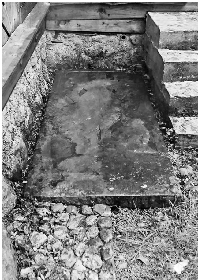
4. Płyta nagrobna przy wejściu do zakrystii. Tombstone next to the entrance to the sacristy.