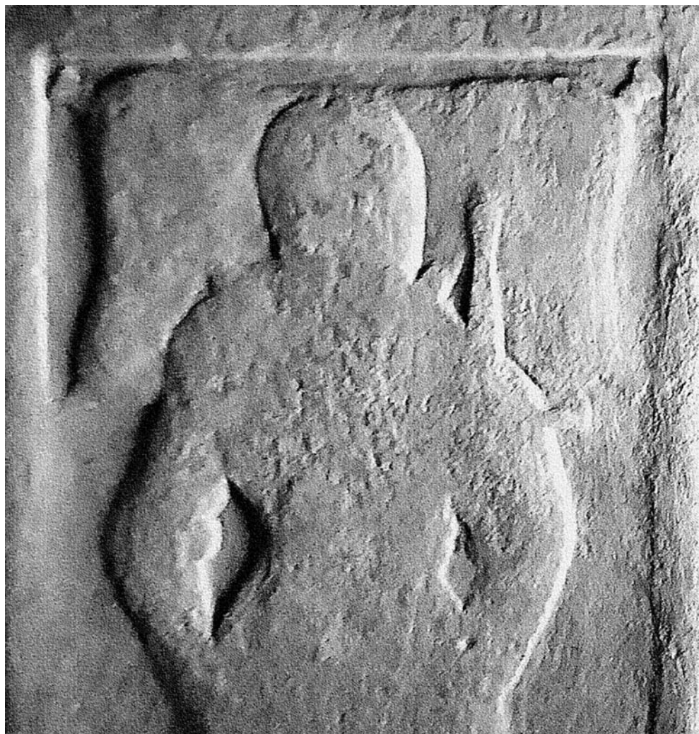
2. Część górna płyty nagrobnej z Narwi. Upper part of the tombstone from Narew.