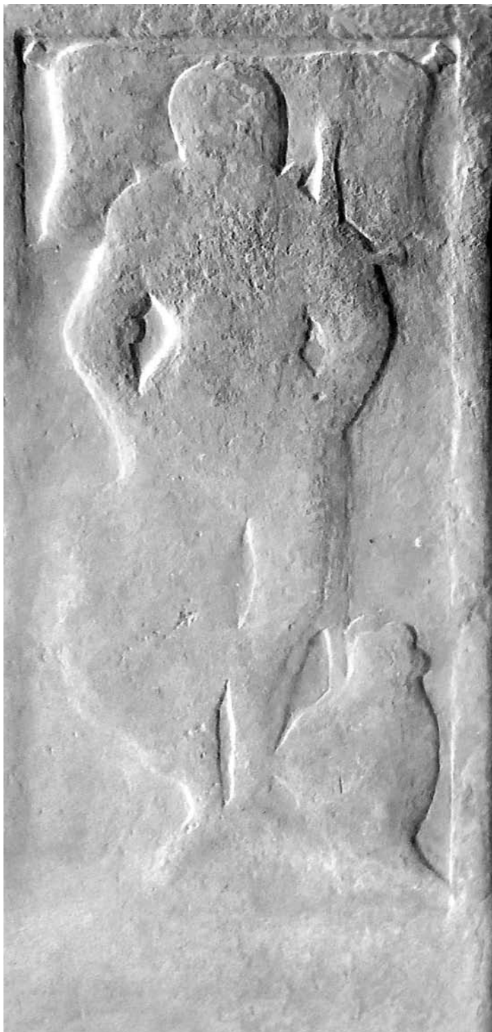
1. Płyta nagrobna Macieja Szymanowskiego z kościoła rzymskokatolickiego w Narwi.