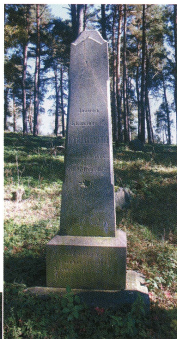
13. Mizar w Bohonikach. Nagrobek Jakuba Adamowicza z 1899 r. Fot. 2013.

Cemetery in Bohoniki. Tombstone of Józef Bajraszewski from 1873. Photo: 2013.