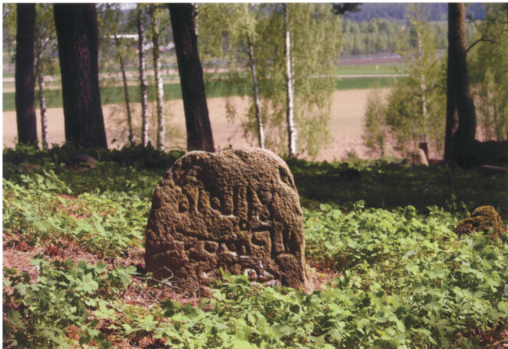
9. Mizar w Bohonikach. Fot. 2013. Cemetery in Bohoniki. Photo: 2013.