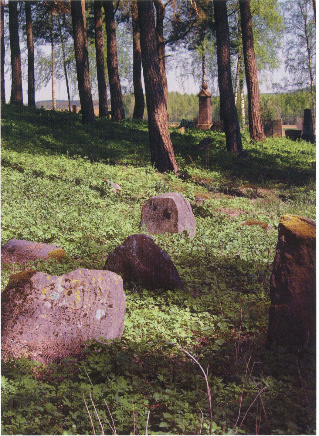
11. Mizar w Bohonikach. Fot. 2013. Cemetery in Bohoniki. Photo: 2013.