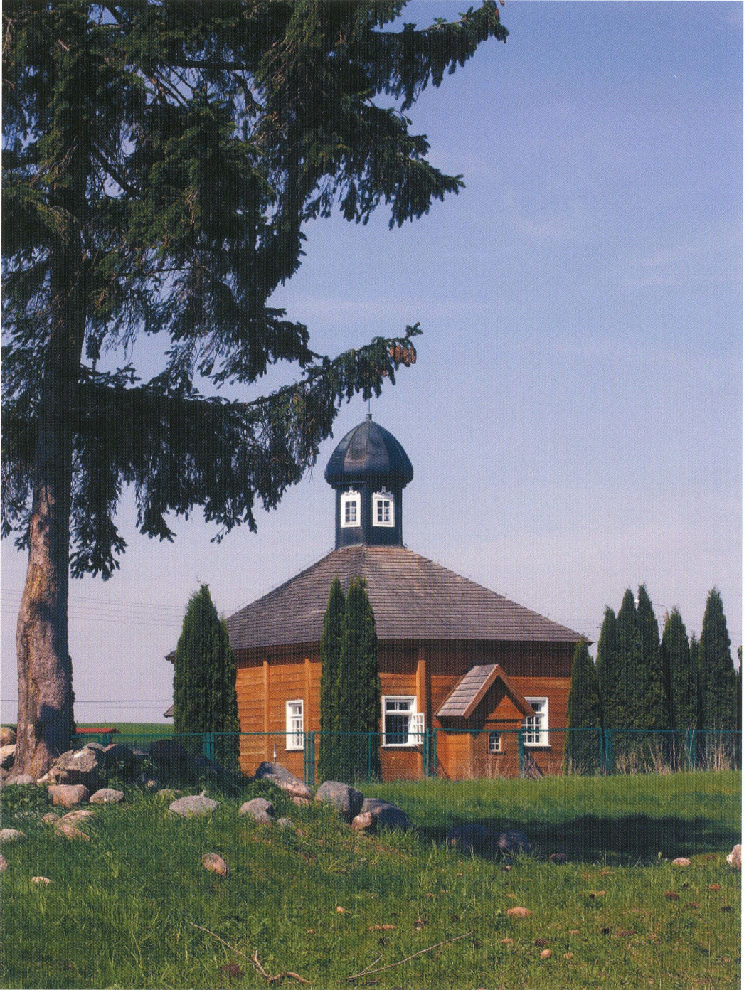
6. Meczet w Bohonikach; elewacja tylna (południowa) z mihrabem. Fot. 2013. Mosque in Bohoniki; back (southern) elevation with a mihrab. Photo: 2013.