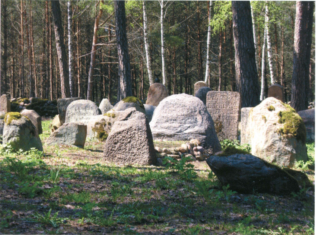
4. Mizar w Kruszynianach. Fot. 2013. Cemetery in Kruszyniany. Photo: 2013.

Obecnie w granicach Rzeczypospolitej znajdują się trzy czynne cmentarze muzułmańskie: w Warszawie, założony w XIX w., Bohonikach i Kruszynianach, założone po 1679 r. Cmentarze w Bohonikach i Kruszynianach stanowią niespotykane na skalę kraju muzułmańskie nekropolie, będące świadectwem egzystowania muzułmanów w państwie chrześcijańskim. Cenne są nie tylko ze względu na ich zabytkowe walory językowe, zawarte w inskrypcjach nagrobnych, lecz stanowią też nieocenione źródło do badań nad genealogią rodów tatarskich, pozostając niekiedy jedynym źródłem wiedzy wobec zniszczeń materiału metrykalnego. Społeczeństwo tatarskie, żyjące w otoczeniu chrześcijańskim, w sposób naturalny ulegało asymilacji, cmentarz jest więc doskonałym miejscem do obserwacji tego procesu.