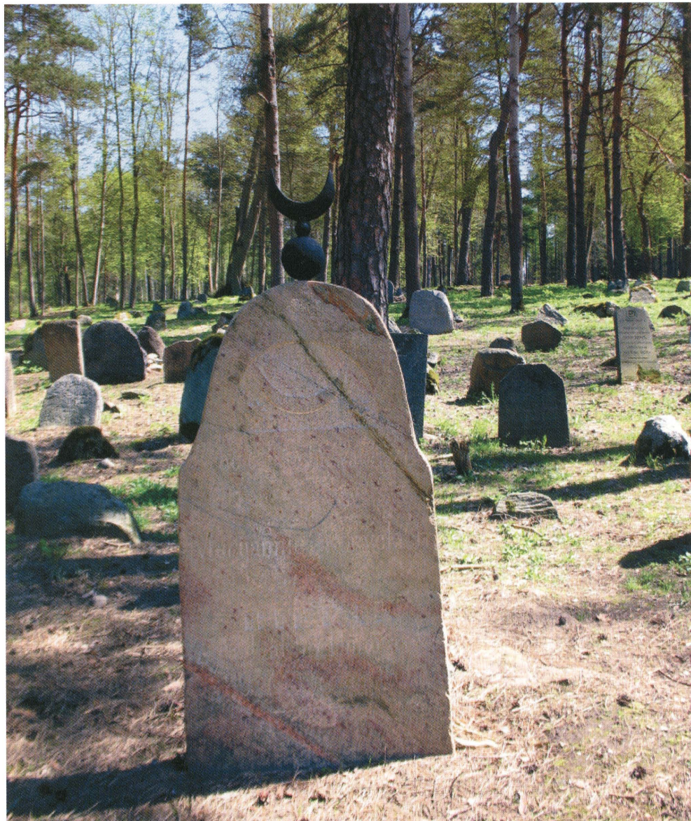
← 17. Mizar w Kruszyńnianach. Fot. 2013. Cemetery in Kruszyńniany. Photo: 2013.