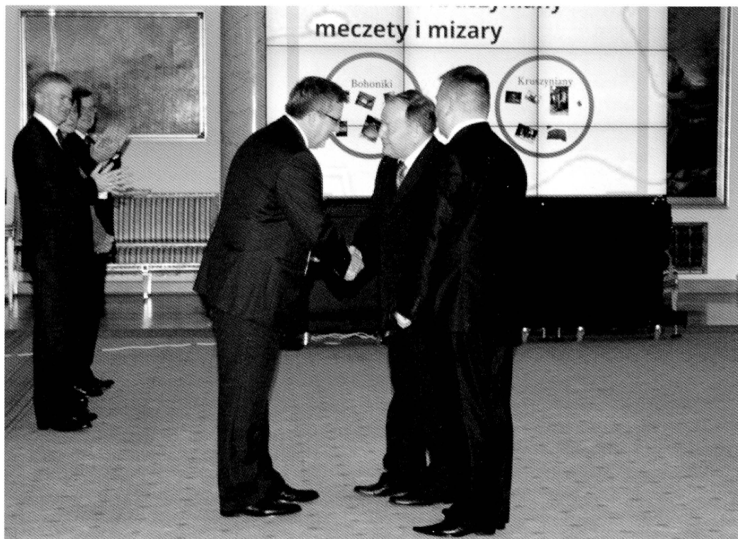
1. Warszawa. Uroczystość w Pałacu Prezydenckim. Fot. 2012. Warsaw. Ceremony at the Presidential Palace. Photo: 2012

Meczet i mizar w Bohonikach: Bohoniki, gmina Sokółka, powiat sokólski, województwo podlaskie; Numer rejestru zabytków: A-60 decyzja WKZ w Białymstoku z dnia 07.11.1966 r. l.dz. KL.III-1/261/66 – meczet; A-61 decyzja WKZ w Białymstoku z dnia 31.03.1988 r. l.dz. KL.WKZ-5340/21/87 – mizar; B-212 decyzja PWKZ z dnia 07.09.2009 r. RR-IM-J/4011-14/09 – 18 zabytkowych nagrobków;