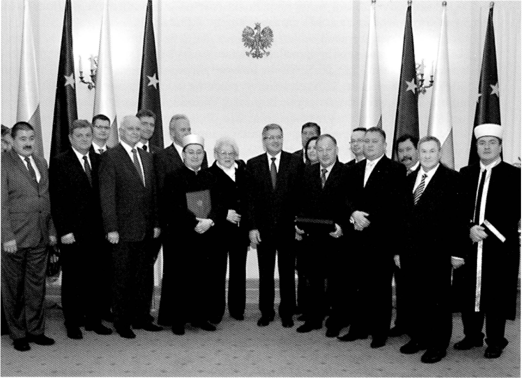
2. Warszawa. Uroczystość w Pałacu Prezydenckim, delegacja z województwa podlaskiego. Fot. 2012. Warsaw. Ceremony at the Presidential Palace, a delegation from the voivodeship of Podlasie. Photo: 2012

i Kruszyńniany leżały na terenie województwa białostockiego. W ramach tego województwa Kruszyńniany wchodziły w skład powiatu grodzieńskiego, zaś Bohoniki sokólskiego.