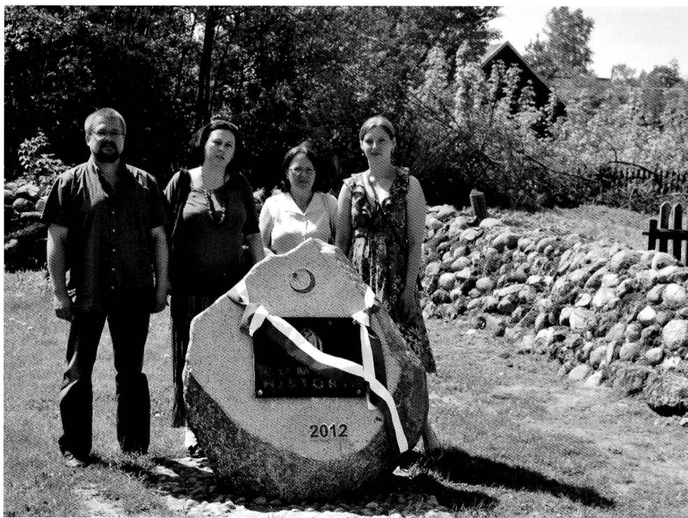
3. Kruszyniany. Odświeżenie pamiątkowej tablicy. Fot. 2013. Kruszyniany. Unveiling the commemorative plaque. Photo: 2013.