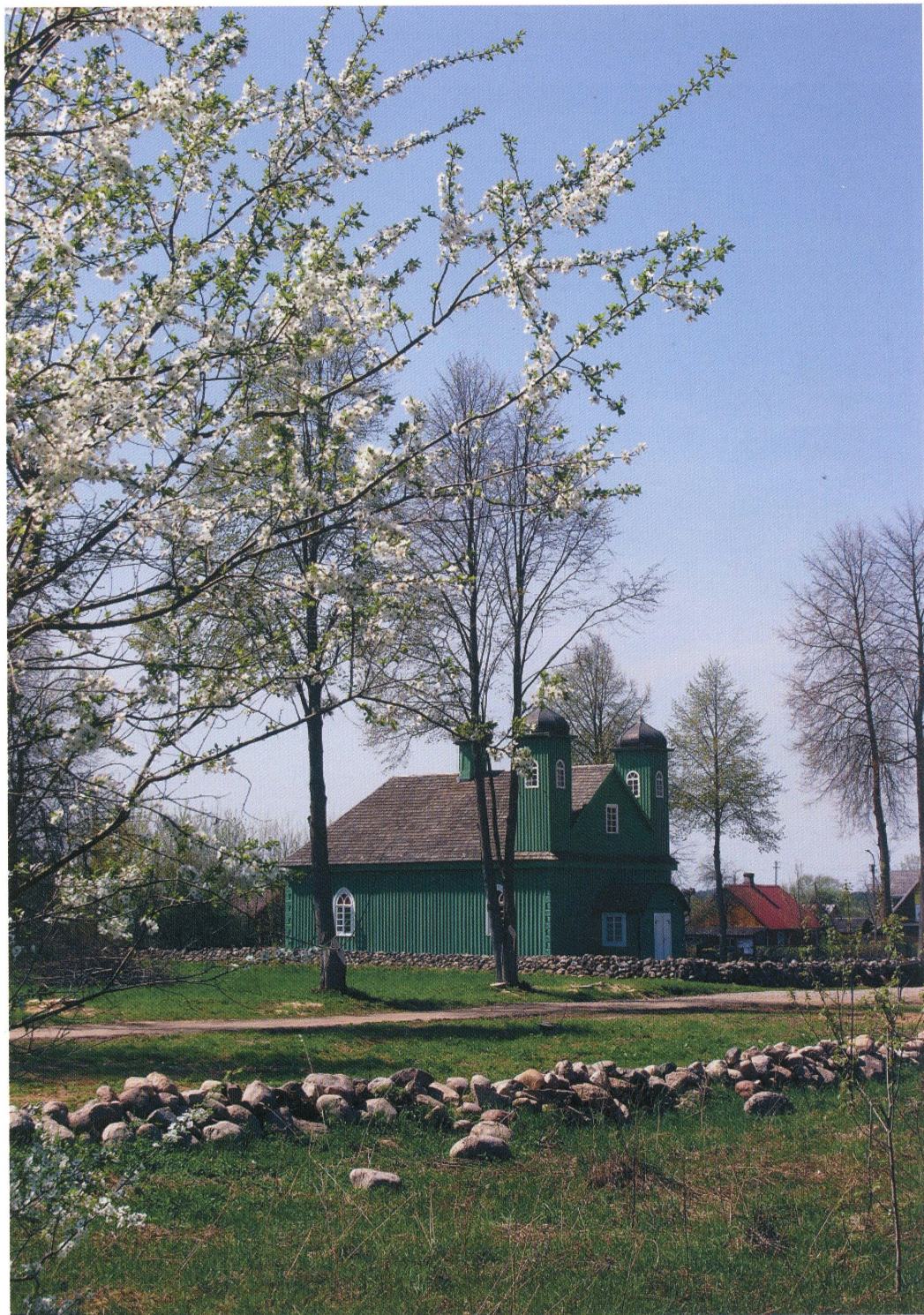
14. Meczet w Kruszynianach. Widok ogólny od strony pół.-wsch. Fot. 2013. Mosque in Kruszyniany. General view from the north-east. Photo: 2013.