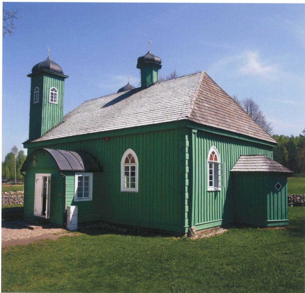
15. Meczet w Kruszynianach. Widok od strony pld.-zach. Fot. 2013. Mosque in Kruszyniany. View from the south-west. Photo: 2013.