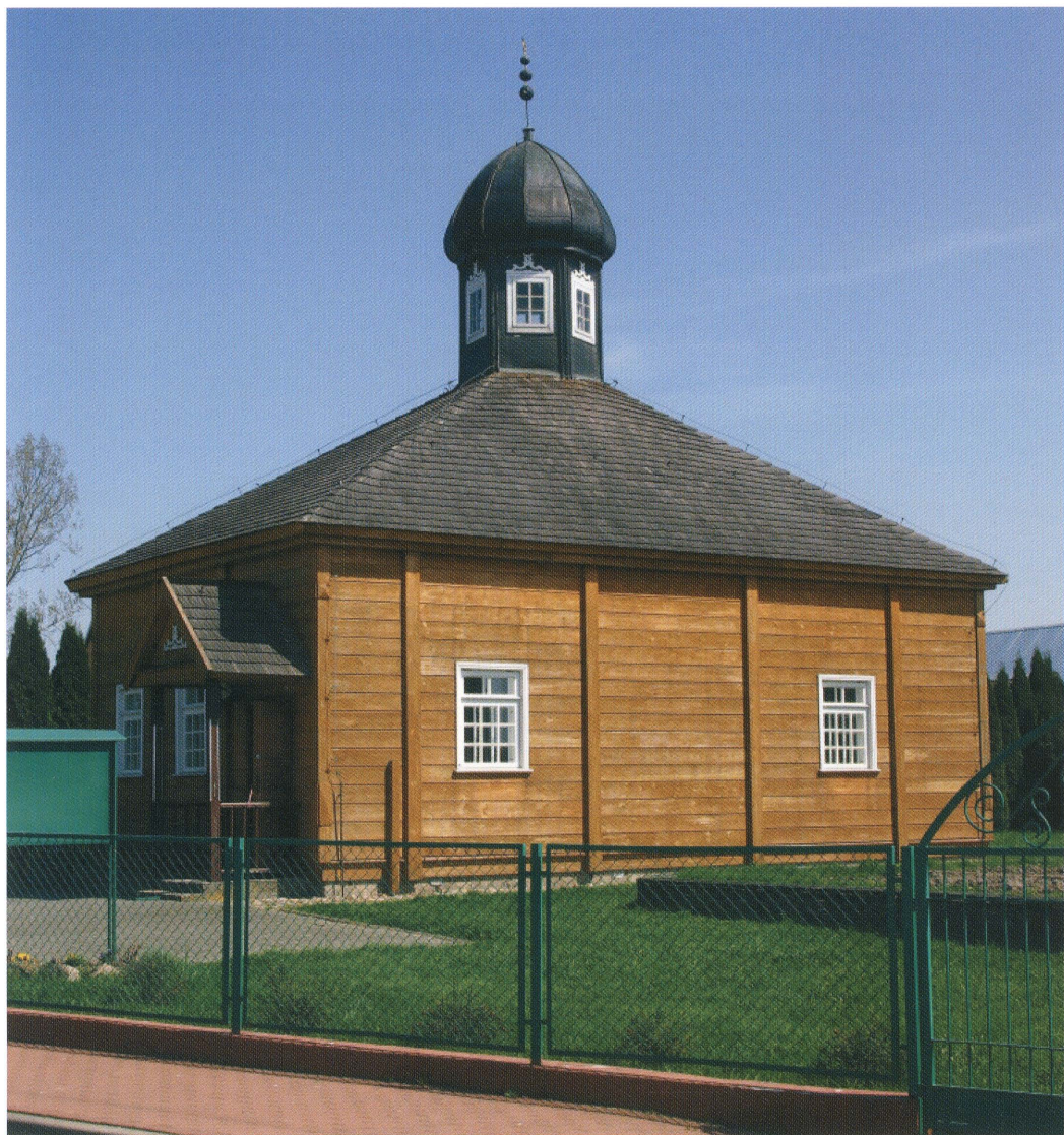
7. Meczet w Bohonikach; elewacja boczna zachodnia. Fot. 2013.

Mosque in Bohoniki; western side elevation. Photo: 2013.