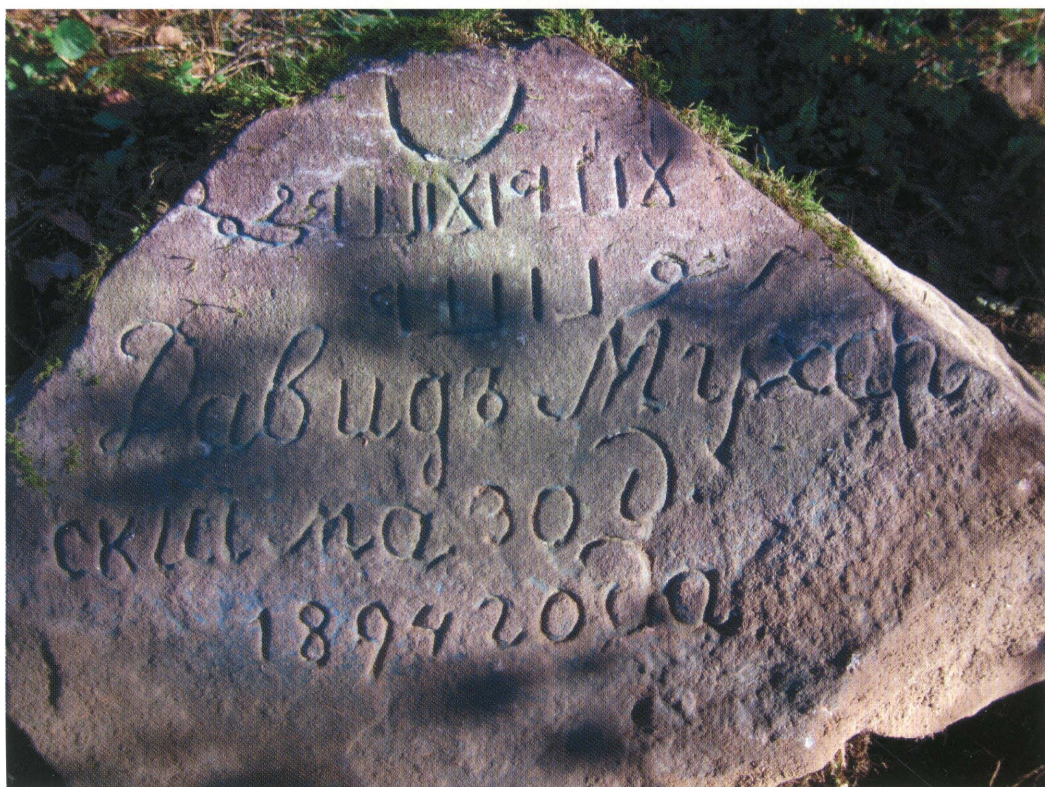
10. Mizar w Bohonikach. Nagrobek Dawida Mucharskiego z 1894 r. Fot. 2013. Cemetery in Bohoniki. Tombstone of Dawid Mucharski from 1894. Photo: 2013.