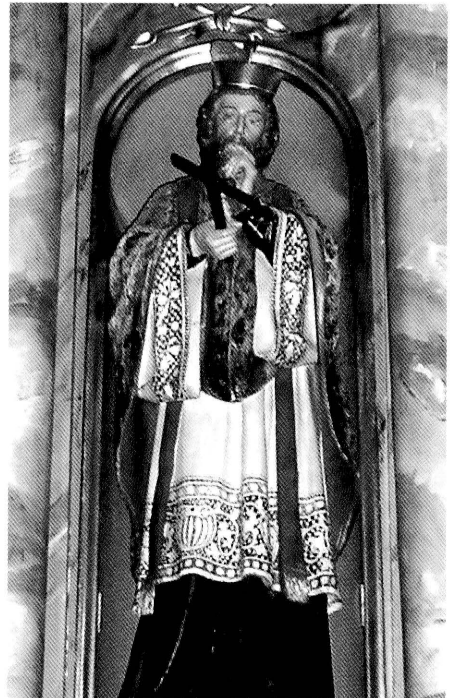
17. Studzieniczna. Figura św. Jana Nepomucena z XIX-wieku w ołtarzu głównym kościoła pw. Matki Boskiej Szkaplerznej. Fot. 2005 Studzieniczna. Nineteenth-century figure of St. John Nepomuk in the main altar in the church of Our Lady of the Scapular. Photo 2005