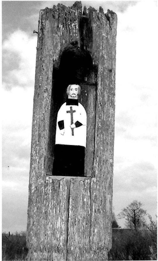
23-25. Wołkusz. Widok na rzeczkę Wołkuszankę i drewnianą kapliczkę słupową św. Jana Nepomucena. Fot. 2005. Drewniana kapliczka słupowa św. Jana Nepomucena. Fot. 2005. Figura św. Jana Nepomucena autorstwa Stanisława Szypra. Fot. 2005. Wołkusz. View of the river Wołkuszanka and wooden post shrine of St. John Nepomuk. Photo 2005. Wooden post shrine of St. John Nepomuk. Photo 2005. Figure of St. John Nepomuk by Stanisław Szyper. Photo 2005.