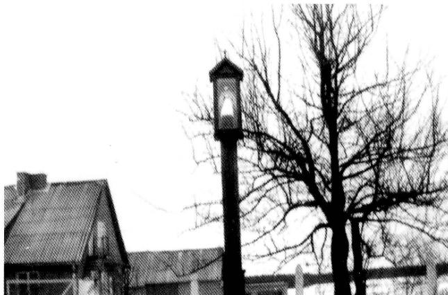
19. Szczebra. Dawna kapliczka drewniana słupowo-szafkowa św. Jana Nepomucena. Fot. 1978 Szczebra. Old wooden post-cupboard shrine of St. John Nepomuk. Photo 1978