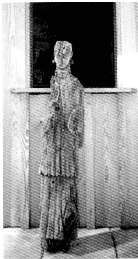
5-8. Janówek. Kapliczka domkowa. Fot. 2005