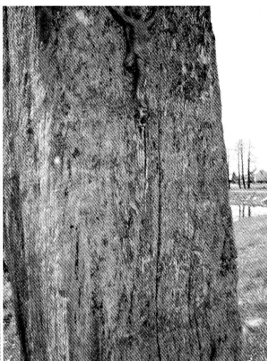
12-13. Kurianka. Słup kapliczki św. Jana Nepomucena. Fot. 2005 Kurianka. Post of a shrine of St. John Nepomuk. Photo 2005