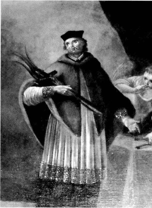
16. Studzieniczna. Obraz św. Jan Nepomucena z XVIII w. w kościele pw. Matki Boskiej Szkaplerznej. Fot. 2005. Studzieniczna. St. John Nepomuk, an eighteenth-century painting in the church of Our Lady of the Scapular. Photo 2005