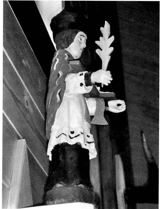
14. Studzieniczna. Rzeźba św. Jana Nepomucena z Serw, przechowywana obecnie w prezbiterium kościoła w Studzienicznej. Fot. 2005 Studzieniczna. Sculpture of St. John Nepomuk from Serwy, today in the presbytery of the church in Studzieniczna. Photo 2005