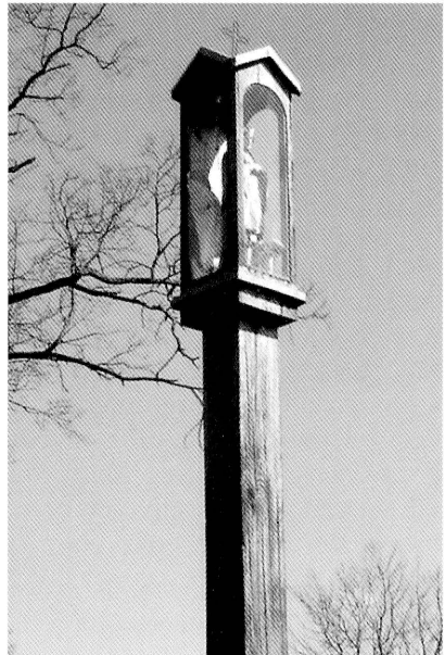
21-22. Turówka. Widok na rzeczkę Turówkę i kapliczkę słupową św. Jana Nepomucena. Fot. 2005. Kapliczka słupowa św. Jana Nepomucena. Fot. 2005