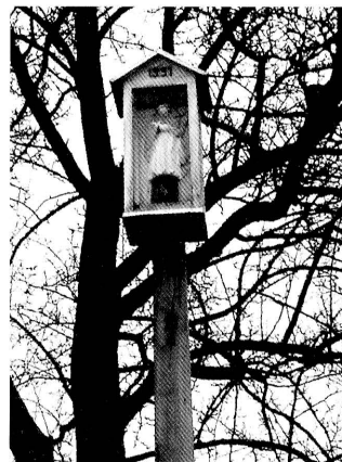
20. Szczebra. Kapliczka słupowo-szafkowa św. Jana Nepomucena z 1991 roku. Fot. 2005 Szczebra. Post-cupboard shrine of St. John Nepomuk from 1991. Photo 2005

dobnie jak i w Studzienicznej, XVIII bądź XIX wieku. W 1795 roku utworzono w Szczebrze parafię, w obrębie, której leżała wówczas Studzieniczna 58 . Odnowiona 14 lat temu kapliczka stoi na wysokim słupie przy ogrodzeniu posesji Wacława Dawidejta, tuż przy drodze prowadzącej z Augustowa do Suwałk i w niedalekiej odległości od rzeki Blizny. Początkowo, o czym wspominali rozmówcy, jej skrzynka wisiała na sąsiadującym z kapliczką drzewie, a następnie przeniesiono ją na drewnianą kolumnę . Wykonana była w formie oszklonej z trzech stron, prostokątnej szafki, nakrytej dwuspadowym daszkiem, zwieńczonym małym kutym krzyżem 59 . Podstawę jej stanowił podwójnie profilowany słup ustawiony po przeciwnej stronie drzewa 60 . Z czasem uległa zniszczeniu. Obecna kapliczka pobudowana została w 1991 roku, o czym świadczy wyryta na jej frontonie data. Umieszczona jest na wysokim, czworobocznym słupie. Ma formę prostokątnej skrzynki, z trzech stron oszklonej i przykrytej dwuspadowym daszkiem. Ustawiona jest szczytem do drogi. Drewniana figurka świętego jest polichromowana. Jan Nepomucen ubrany jest w czarną sutannę i takiż biret, białą rokietę i brązowy mantolet. Ukazany frontalnie, z głową przechyloną na prawo, w złożonych na piersi rękach trzyma przytulony do prawego boku biały krzyż. Kapliczkę wykonał nieżyjący już Jan Juśkiewicz 61 . Autor rzeźby i czas jej wykonania są nieznane.