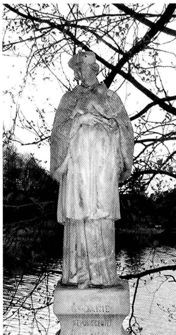
18. Studzieniczna. Figura św. Jana Nepomucena z piaskowca na wyspie na Jeziorze Studzienicznym. Fot. 2005 Studzieniczna. Sandstone figure of St. John Nepomuk on an island on Lake Studzieniczna. Photo 2005

Ponadto w prezbiterium kościoła znajduje się mała figurka św. Jana Nepomucena, pochodząca z miejscowości Serwy, którą uratowano przed kradzieżą 52 .