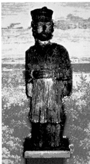
15. Figura św. Jana Nepomucena z kapliczki ze Strzelcowizny, obecnie w Muzeum Marii Konopnickiej w Suwałkach. Fot. 2004

Figure of St. John Nepomuk from a shrine in Strzelcowizna, today at the Maria Konopnicka Museum in Suwałki. Photo 2004