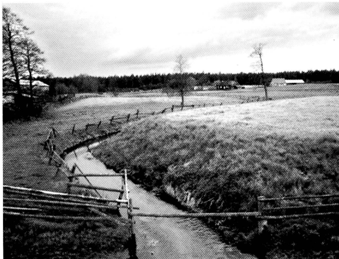
15. Strzelcowizna. Widok na rzeczkę Paniówkę, gdzie do 1960 roku stała kapliczka z figurą św. Jana Nepomucena. Fot. 2005

Figure of St. John Nepomuk from a shrine in Strzelcowizna, today at the Maria Konopnicka Museum in Suwałki. Photo 2004