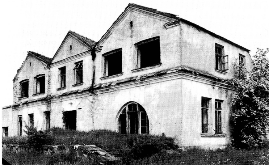
2. Elewacja południowa i wschodnia. Fot. J. Tołłoczko, 1999