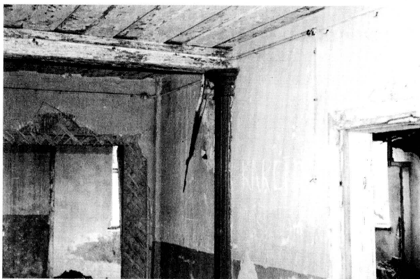
4. Tołoczki Wielkie, dwór. Widok pomieszczenia na poddaszu. Fot. J. Tołoczko, 1999

Dwór – parterowy z użytkowym poddaszem, częściowo podpiwniczony, murowany, na fundamencie z kamienia polnego i cegły ceramicznej. Wzniesiony na planie prostokąta, dwuipółtraktowy, z sienią przelotową na osi głównej, z prostokątną dobudówką od strony zachodniej mieszczącą pierwotnie pomieszczenia kuchenne. Budynek główny nakryty dachem dwuspadowym, z jedno- i dwuosiowymi lukarnami w obu połaciach dachowych. Dobudówka nakryta dachem pulpitowym. Nie zachowało się prawie nic z pierwotnego, wewnętrznego wyposażenia dworu, poza drewnianymi schodami w sieni z drewnianą balustradą oraz słupowym systemem podpór w sieni podtrzymującym część belkowego stropu.