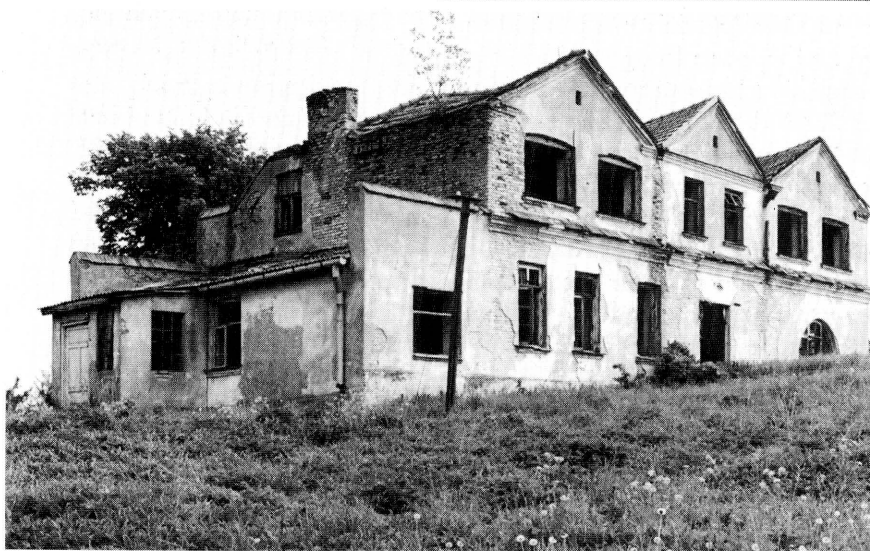
3. Elewacja południowa i zachodnia. Fot. J. Tołłoczko, 1999