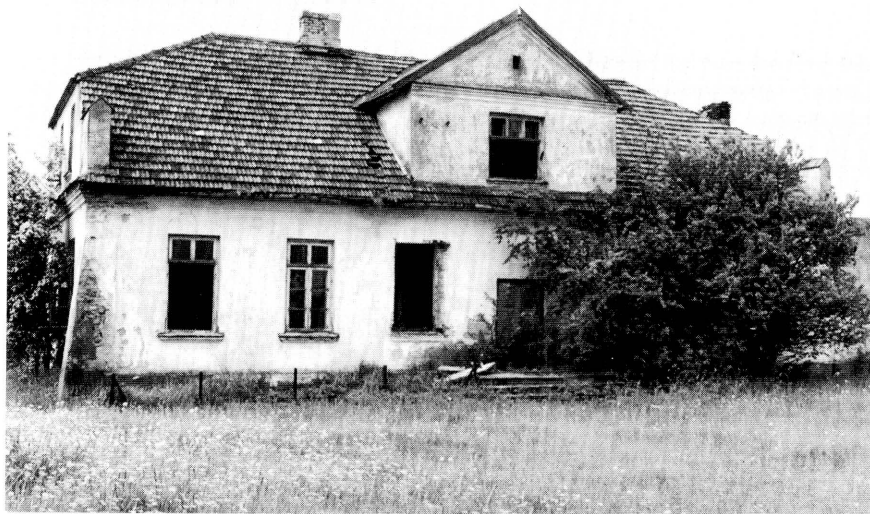
1. Elewacja północna. Fot. J. Tołłoczko, 1999