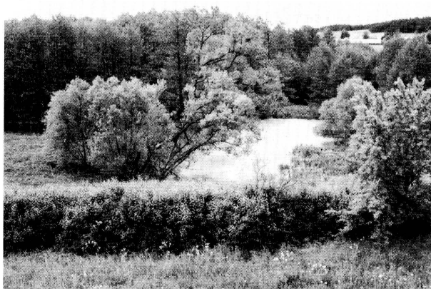
5. Tołoczki Wielkie, ogród. Widok na południowy fragment założenia. Fot. J. Tołoczko, 1999